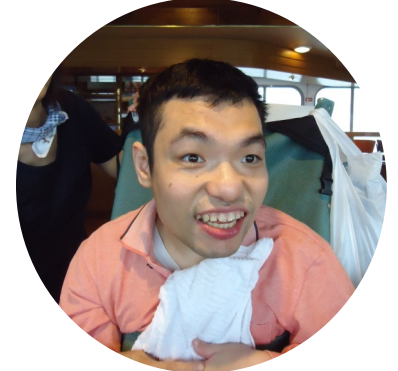
港めぐりの船内 男前の笑顔がはじけたで賞