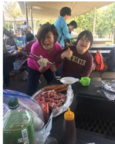
バーベキュー 準備OK. パッチグーで賞