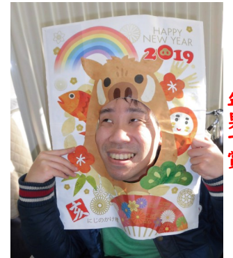
あけましておめでとう 年男で賞