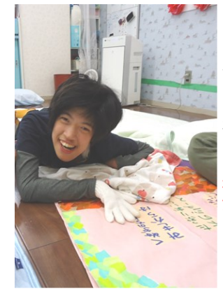
歌詞ボードづくり 大好きな歌にご機嫌で賞