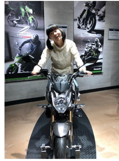
カワサキ・ワールド 女性ライダー カッコいいで賞