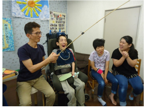
夏恒例 つりゲーム 今年は何を つり上げたで賞