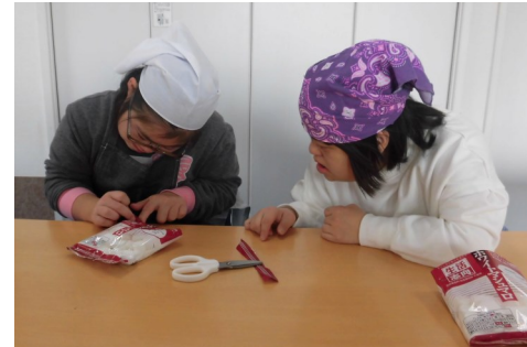
デザートづくり 力を合わせて考えま賞