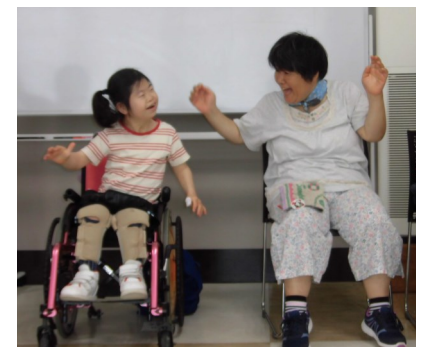
リズム体操 二人は仲良しで賞