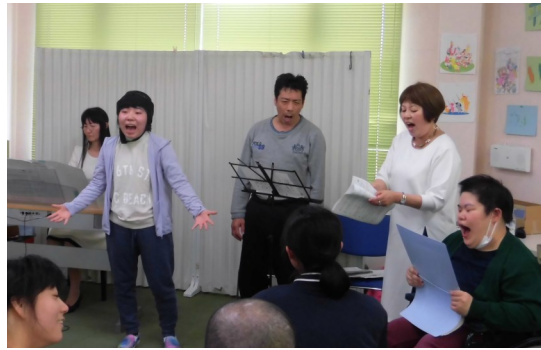
「いと」コンサート みんなで合唱 いい気分で賞