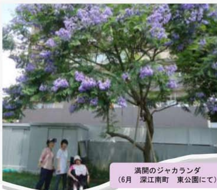
満開のジャカランダ (6月 深江南町 東公園にて)