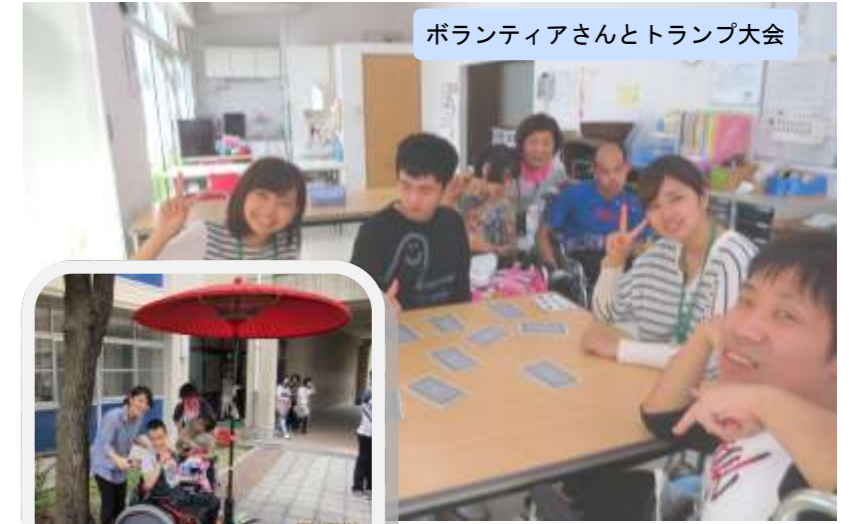
ボランティアさんとトランプ大会

ボランティアに來させてもらって早1年、皆さんと過ごす時間が私にとって本当に大切なものになりました。いつも沢山お話をしてくれて、一緒にご飯を食べたり、出掛けたりしてくれてありがとう。私が作る下手くそな味噌汁を食べてくれて嬉しいです。この間は御影高校の文化祭にも行きましたね。これからも皆さんと楽しく関わっていききたいと思っています。